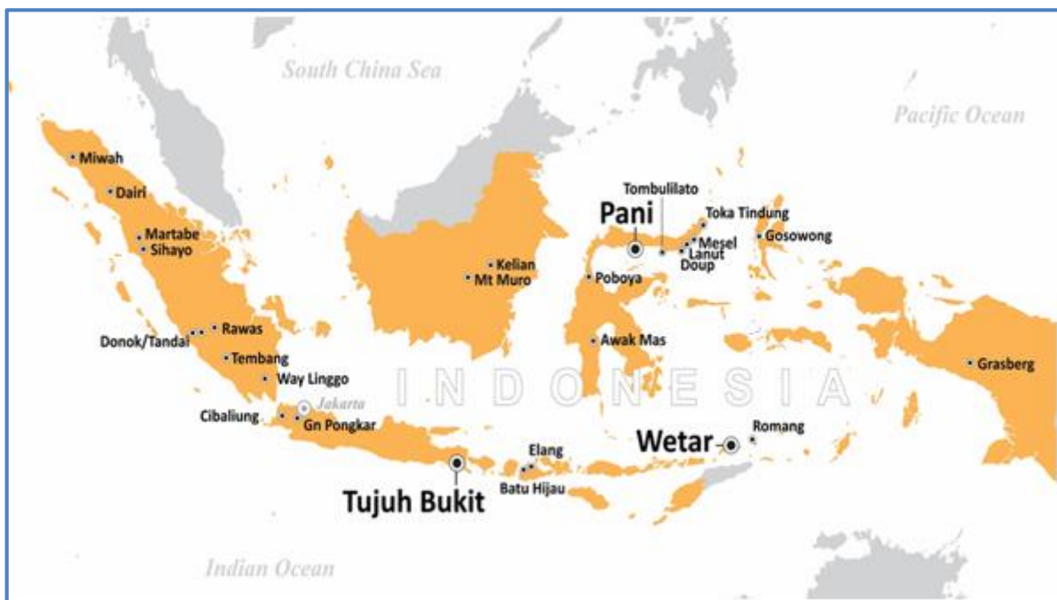
Gambar 1: Daerah Kegiatan Eksplorasi yang Dilakukan oleh Merdeka di Indonesia

Adapun total biaya yang dikeluarkan untuk mendukung seluruh kegiatan eksplorasi yang dilakukan Merdeka di Indonesia selama bulan Agustus 2020 adalah sebesar Rp15,86 miliar.